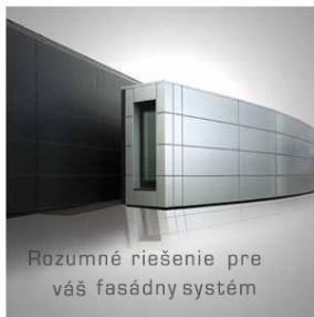
Rozumné riešenie pre váš fasádný systém

Výstava bola súčasťou medzinárodného projektu Mobile Exhibition of Urbanism, Landscape Design, Land-Use Planning and GIS realizovaného s finančnou podporou International Visegrad Fund a jej širším zameraním je otvoriť priestor pre väčšiu vzájomnú informovanosť laickej a odbornej verejnosti o prístupoch k tvorbe a k realizácii územnoplánovacích podkladov a územných plánov od zonálnych až po regionálne štruktúry.